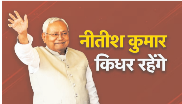
नीतीश कुमार किधर रहेंगे

राष्ट्रीय जनता दल में दूसरे नंबर के नेता और बिहार के पूर्व उपमुख्यमंत्री तेजस्वी यादव ने सोमवार को कहा कि उनकी पार्टी के दरवाजे नीतीश कुमार के लिए बंद हो चुके हैं। तेजस्वी के इस बयान को उन चर्चाओं पर विरोध के रूप में देखा गया, जो नीतीश कुमार को लेकर इन दिनों चल रही हैं। चर्चा गरम है कि नीतीश कुमार विधानसभा चुनाव से पहले एक बार फिर ईडिया गठबंधन में वापसी कर सकते हैं। दरअसल बीजेपी ने महाराष्ट्र में जिस तरह से शिव सेना नेता एकनाथ शिंदे को मुख्यमंत्री नहीं बनाया, उससे जेडीयू को आशंका सता रही है कि विधानसभा चुनाव के बाद बीजेपी शायद नीतीश कुमार को फिर सीएम न बनाए। हालांकि बीजेपी के स्थानीय नेता बार-बार यह कह रहे हैं कि नीतीश कुमार ही एनडीए के नेता होंगे और जीत के बाद मुख्यमंत्री भी नीतीश कुमार ही बनेंगे। इसके बाद भी नीतीश कुमार को लेकर चल रही अटकलें धमने का नाम नहीं ले रही हैं।