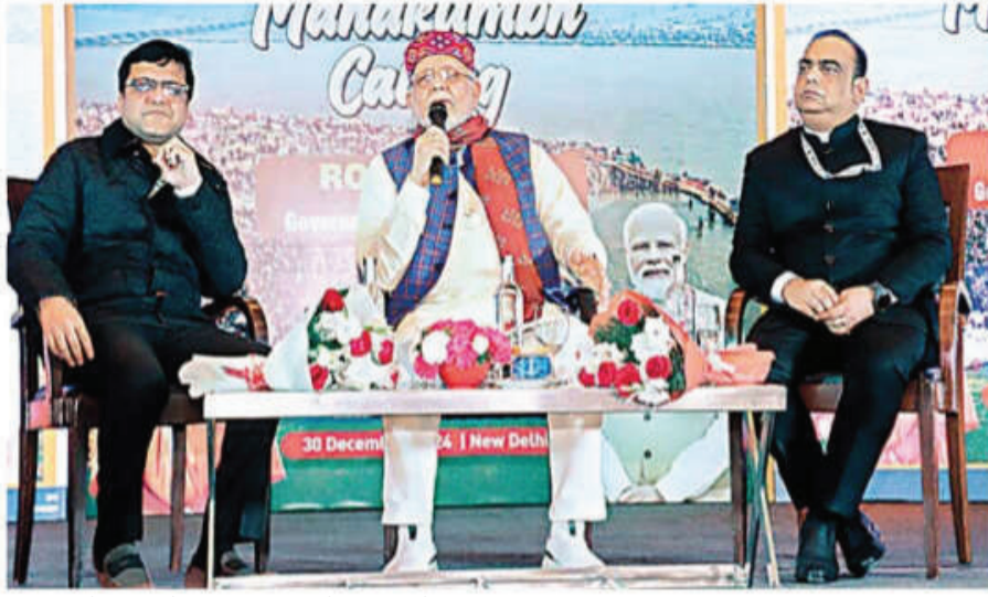
महाकुंभ की जानकारी देते वित्त एवं संसदीय कार्य मंत्री सुरेश खन्ना व अन्य।

वित्त एवं संसदीय कार्य मंत्री सुरेश खन्ना और आबकारी एवं मद्य निषेध राज्य मंत्री (स्वतंत्र प्रभार) नितिन अग्रवाल ने इस कार्यक्रम का नेतृत्व किया। खन्ना ने दिल्ली के उपराज्यपाल विनय कुमार सक्सेना ने दिल्ली की जनता को महाकुंभ में शामिल होने का निमंत्रण दिया। सुरेश खन्ना ने बताया कि महाकुंभ-2025 में 45 करोड़ श्रद्धालुओं के आने की